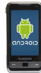
Pametni Android telefon